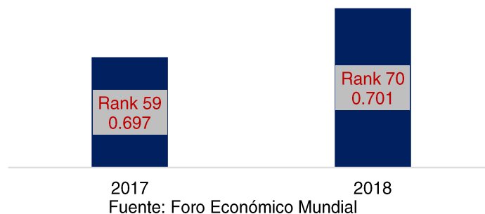
Gráfico 2. Índice de Brecha de Género 2018: República Dominicana

En cuanto a los subíndices que lo componen, República Dominicana ha logrado cerrar significativamente la brecha de género en Educación y Salud, quedándole pendiente aproximadamente un 1% de la misma, así mismo la primera tuvo un incremento de un 0.61%, evidenciado por el incremento en la tasa de inscripción en la educación primaria, mientras el subíndice Salud se mantuvo invariable.