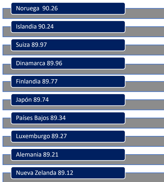
Líderes mundiales del progreso social