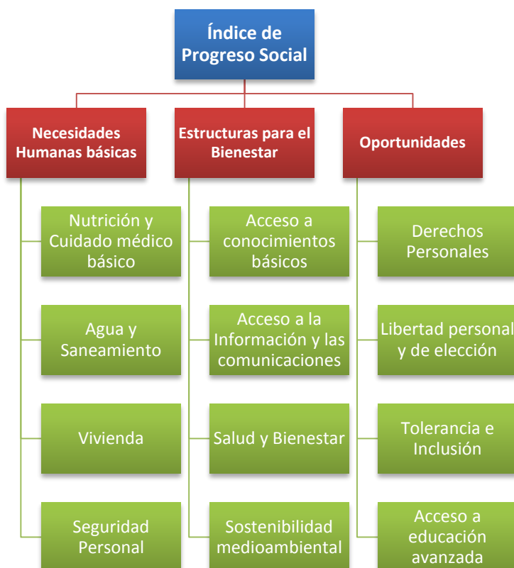
Ilustración 1: Marco de medición IPS. que consiste en 3 grandes dimensiones.

El cálculo del IPS no es más que el promedio simple de las tres dimensiones que lo componen, bajo el supuesto de que todas tienen el mismo peso para el logro del progreso social. Las dimensiones también son calculadas como el promedio simple de los cuatro componentes que las integran. Para calcular los componentes se realiza un análisis de factores para cada indicador, con el objetivo de lograr estandarizarlos y poder promediarlos de manera ponderada.